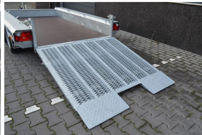
Verlengde oprijklep in optie L=150 cm 101.009.004