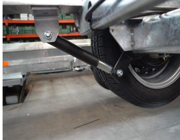
Vlemmix schokdempers 101.009.003