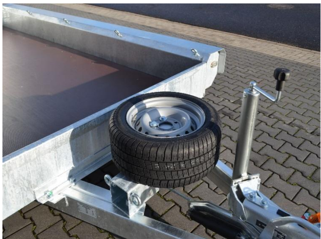
Reserve wiel en houder 101.009.002