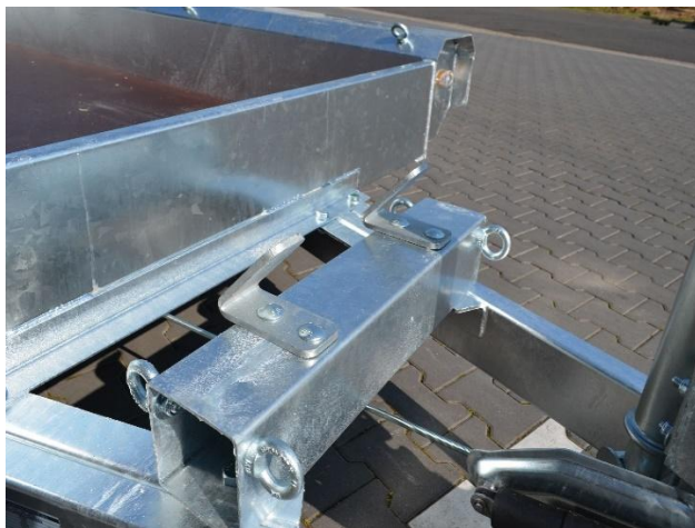
Vlemmix graafbaksteun 101.009.001