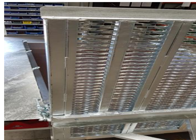
Versteving klep standaard L=130 cm 101.009.005