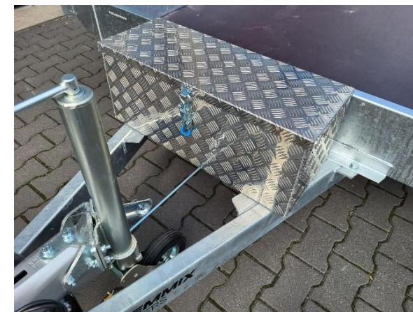
Aluminium bodemplaat gemonteerd Afm. 3x1.5m 881.001.063 4x1.5m ... 081 4x1.8m ...082 Extra verstevigingskokers 3 stuks 101.009.005 Aluminium gereedschapskist.